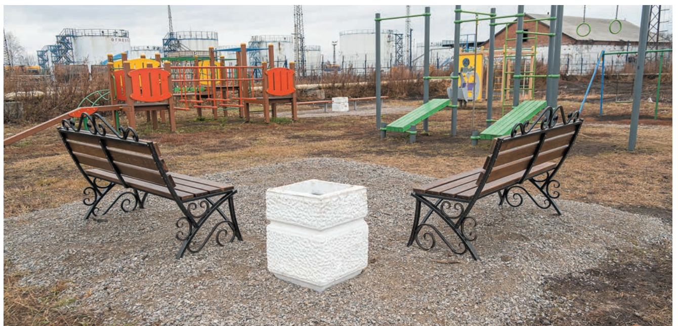
НОВЫЕ ЛАВКИ, УСТАНОВЛЕННЫЕ ВОЗЛЕ ИГРОВОЙ ПЛОЩАДКИ НА СТАНЦИИ ЕВСИНО

Также ЭЛСИ совместно с администрацией Евсинского сельсовета организовали высадку елей на облагораживаемой территории. Получился мини-парк для детей и взрослых. «Результатом более чем доволен. Теперь у нас есть пространство для досуга в шаговой доступности. Люди реально рады и очень благодарны — это самое главное», — считает Евгений.