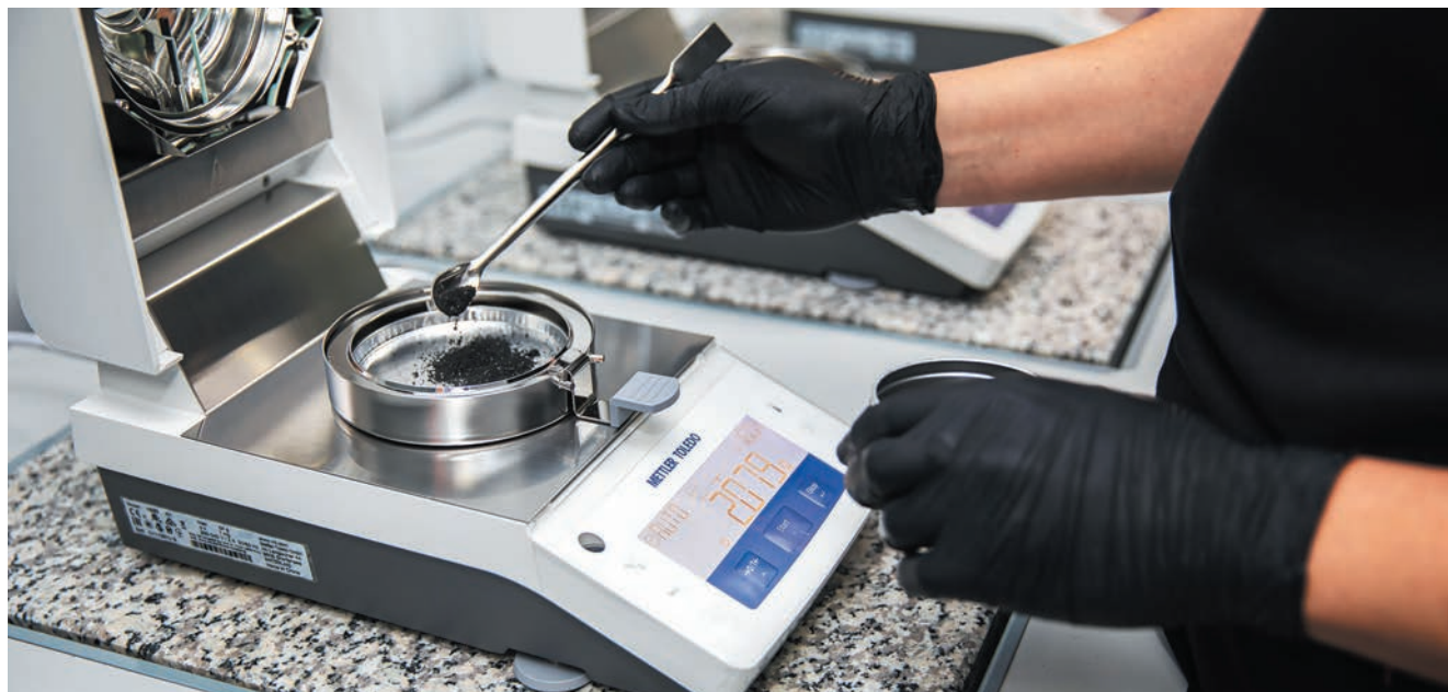
АНАЛИЗ ПРОБЫ УГЛЯ НА НОВОМ ОБОРУДОВАНИИ