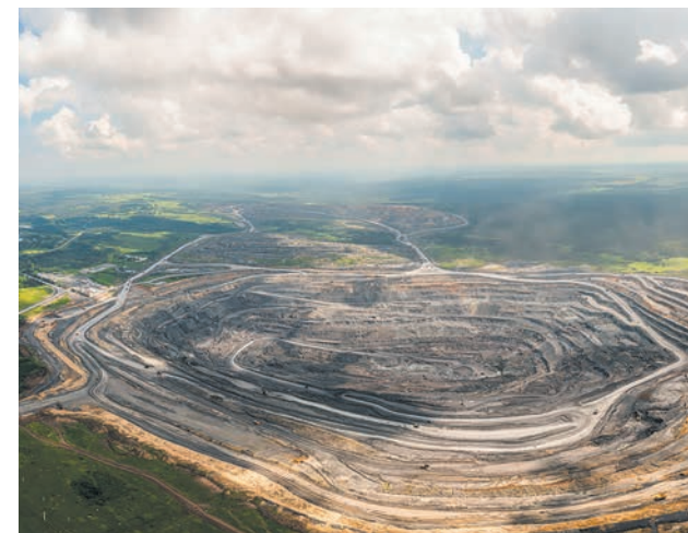
РАЗРЕЗ ВОСТОЧНЫЙ

ЭТО СТАЛО ВОЗМОЖНЫМ БЛАГОДАРЯ ПЕРЕНОСУ ПОДСТАНЦИИ И ЛЭП ЗА ГРАНИЦЫ ГОРНОГО ОТВОДА