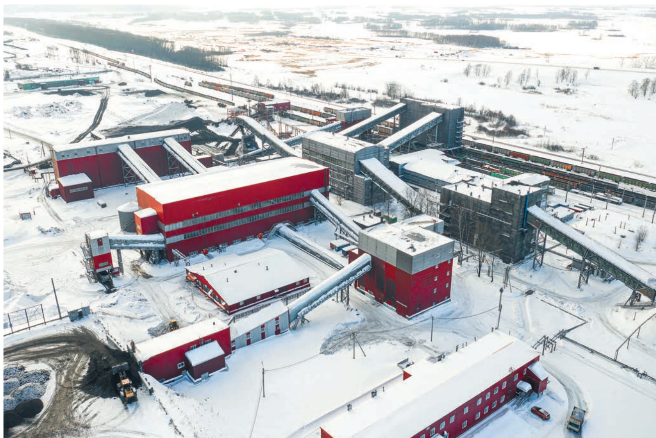
ОБОГАТИТЕЛЬНЫЕ ФАБРИКИ «ЛИСТВЯНСКАЯ-1» И «ЛИСТВЯНСКАЯ-2»