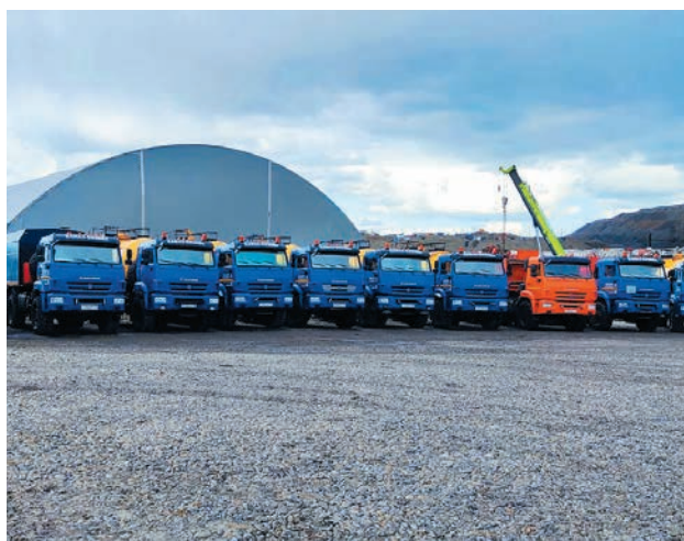
В АРСЕНАЛЕ ТРАНСПОРТНОГО ЦЕХА 158 ЕДИНИЦ ТЕХНИКИ