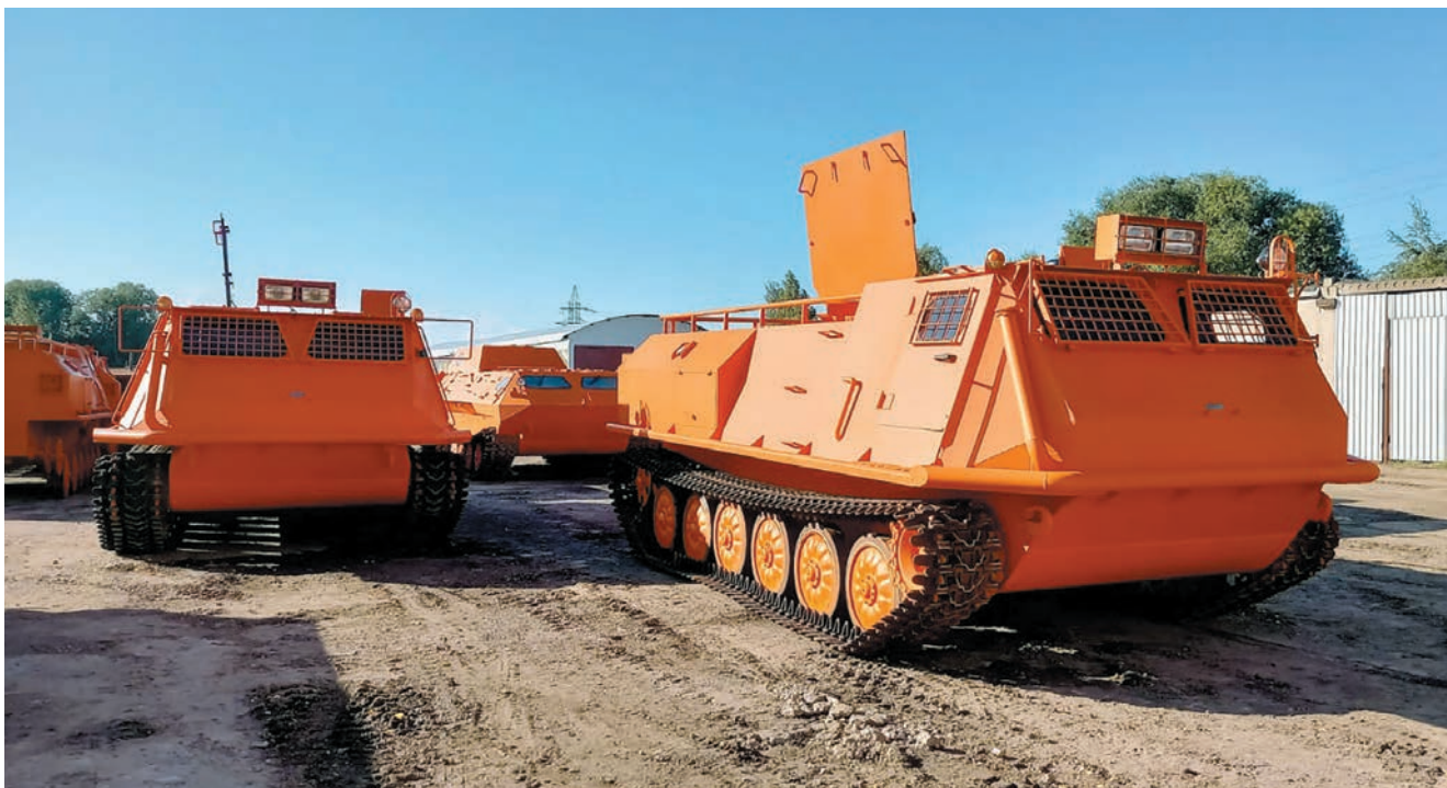
ГУСЕНИЧНЫЙ СНЕГОБОЛОТОХОД ПОМОГАЕТ ОРГАНИЗОВАТЬ РАБОТУ НА СЛОЖНЫХ УЧАСТКАХ