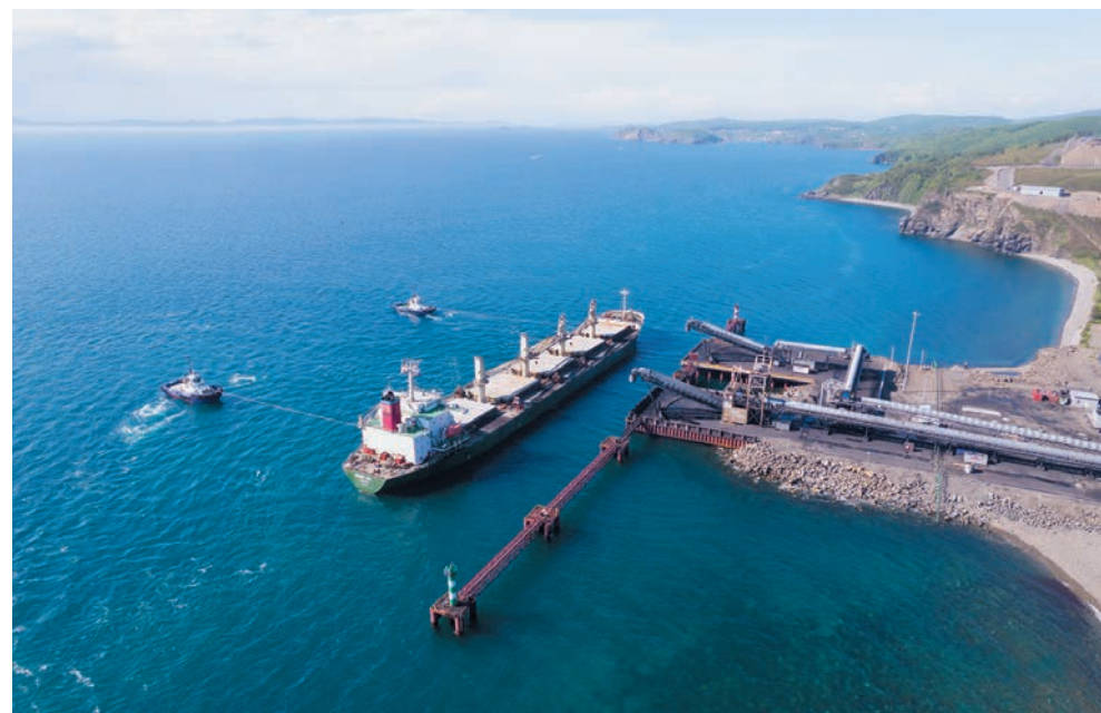
«ПОРТ ВЕРА» – САМЫЙ ДАЛЬНЕВОСТОЧНЫЙ УГОЛЬНЫЙ ТЕРМИНАЛ КОМПАНИИ

В 2022 году экспортный потенциал Дальнего Востока, наряду с пропускной способностью Восточного полигона в этом направлении, занимает умы производителей, коммерсантов и чиновников далеко за пределами региона. Без обсуждения этих тем и связанных с ними вопросов сложно представить профильный деловой форум или конференцию любого, даже самого высокого уровня. Между тем, под аккомпанемент споров и предположений, ЭЛСИ методично и последовательно развивает проекты угольных морских терминалов «Порт Эльга» и «Порт «Вера» – практический ответ компании на вопросы отраслевых теоретиков.