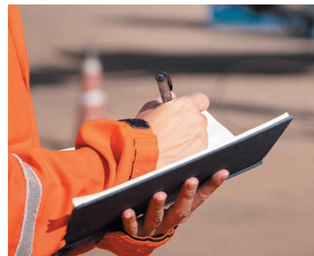
АНАЛИЗ ЗАКУПОК СНИЖАЕТ ЭКОНОМИЧЕСКИЕ РИСКИ КОМПАНИИ

Совместно со Службой безопасности «Разреза Восточного» был установлен факт приобретения специальной техники, характеристики которой не отвечали необходимым техническим требованиям. Действия специалистов безопасности позволили предотвратить ущерб в размере 14 млн рублей.