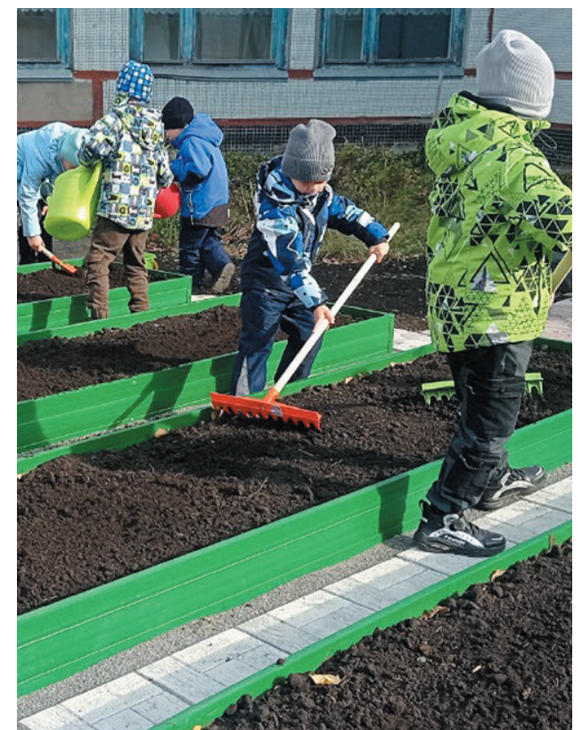
ВОСПИТАННИКИ ДЕТСАДА РАБОТАЮТ НА НОВОМ ОГОРОДИКЕ

ГРАНТОВЫЙ КОНКУРС «РЕГИОН ВОЗМОЖНОСТЕЙ» ПРОВОДИТСЯ КОМПАНИЕЙ ВТОРОЙ ГОД ПОДРЯД. В ЭТОМ ГОДУ НА КОНКУРС ПОСТУПИЛИ 92 ЗАЯВКИ, 33 ПРОЕКТА РЕАЛИЗУЮТСЯ В НОВОСИБИРСКОЙ И КЕМЕРОВСКОЙ ОБЛАСТЯХ. НА ПОДДЕРЖКУ СОЦИАЛЬНО ЗНАЧИМЫХ ИНИЦИАТИВ ВЫДЕЛЕНО 5,3 МЛН РУБЛЕЙ